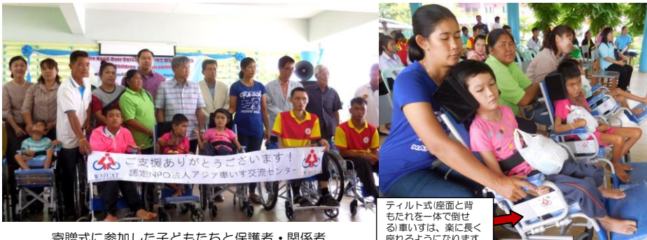
寄贈式に参加した子どもたちと保護者・関係者

今年度は前・後期に分け車いすを寄贈します。前期は6月、26県に住む163名の障がい児に寄贈しました。 6月17日ラオス国境沿いの東北部ノンカーイ県で寄贈式を行い、6名の子どもたちと保護者、35名の先生が参加しました。