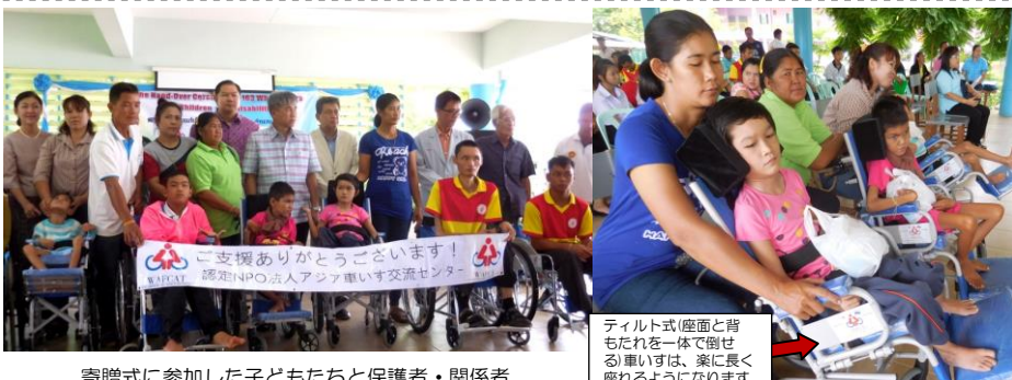
寄贈式に参加した子どもたちと保護者・関係者

今年度は前・後期に分け車いすを寄贈します。前期は6月、26県に住む163名の障がい児に寄贈しました。 6月17日ラオス国境沿いの東北部ノンカーイ県で寄贈式を行い、6名の子どもたちと保護者、35名の先生が参加しました。