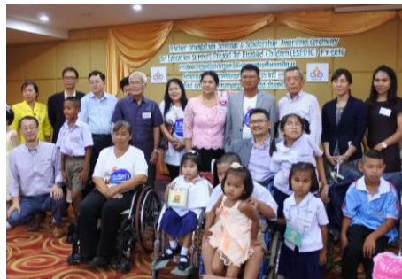
授与式に参加したドナーさん、奨学生と保護者

日本から4名、在タイ3名の奨学金ドナーが支援する子どもたちに奨学金を手渡すため授与式に参加しました。13名の奨学生が式典に参加し、ドナーから直接お土産や証書を受け取りました。式典後の交流会ではドナーと奨学生が歓談し、学校生活や将来の夢などについて楽しくお話をしました。