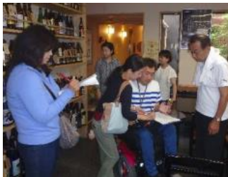
お店の方に障がい者への対応確認