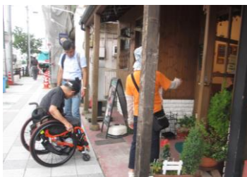
車いすの方によるバリアチェック