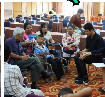
歓談するドナーさんと奨学生