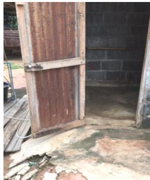
予定工事②トイレ入口ドア ドアを新しくし、入口の幅を広くして、トイレに入りやすくなります