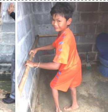
予定工事③トイレ内に手すり設置 ドアから便器までまっすぐ歩いて行けるような手すりを新たに設置します