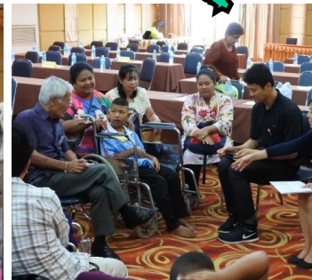
歓談するドナーさんと奨学生