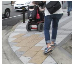
車いすは僅かな傾きでも危険

訪問したシェイクハンズマーク店 (敬称略・順不同) ・おきあがりこぼし ・ひらみ ・桜薬局 ・菊泉堂 ・ドコモショップ刈谷店 ・メンズショップ アイオイ