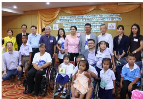
授与式に参加したドナーさん、奨学生と保護者

日本から4名、在タイ3名の奨学金ドナーが支援する子どもたちに奨学金を手渡すため授与式に参加しました。13名の奨学生が式典に参加し、ドナーから直接お土産や証書を受け取りました。式典後の交流会ではドナーと奨学生が歓談し、学校生活や将来の夢などについて楽しくお話ししました。