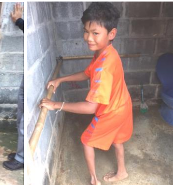
予定工事③トイレ内に手すり設置 ドアから便器までまっすぐ歩いて行けるような手すりを新たに設置します