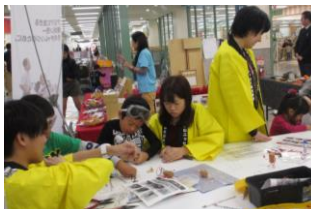
あいおいさんによるワイヤーアート教室