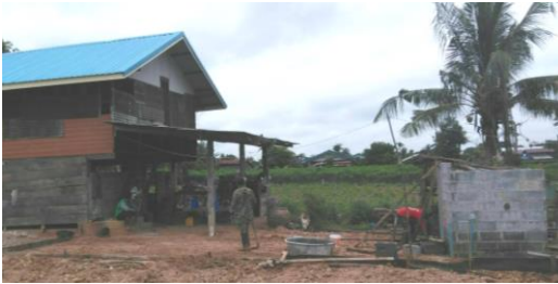
工事前のジョイちゃん宅全景 (左:母屋 右:トイレ)

「WAFCAレポート39号」等で寄付を呼びかけた「ジョイちゃん自宅のバリアフリー支援(10万円)」。すべての工事が無事に終わりました!