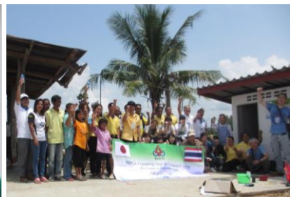
工事完了後みんなで記念撮影