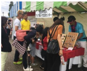
チャリティ商品販売 (大信フェスタ)

アピタ刈谷店で、あいおいニッセイ同和損保の皆さん、愛知県立半田特別支援学校桃花校舎の生徒さんとともに、「Make a Change Day ～1年に1日、ボランティア・市民活動を行う日～」を開催しました。「子ども免許作り」「ワイヤーアート教室」、また生徒さん達による作品展や演奏も行いました。来店した方も作品を手にとり見て、演奏に聞き入っていました。