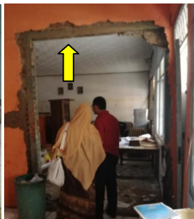
教室のドアが流された跡