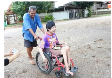
久しぶりの外出に笑顔を見せるディアさん