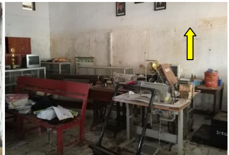
教室の中にも泥・水が浸入