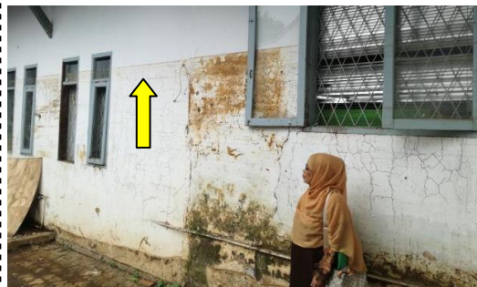
校舎壁に残った跡より水位の高さがわかる

昨年9月21日に西ジャワ州ガルット県(ジャカルタから東に約180km)で発生した集中豪雨・洪水により、死者50名・行方不明者20名の被害があり、役所や病院、特殊教育センターなども全半壊し今もなお復興は進んでいません。病院やセンターの多くの障がい者の方たちが車いす等が足りず、不便で困っています。ご協力をよろしくお願いします!