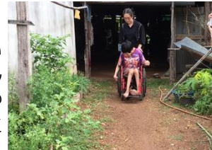
車いすが押しにくい未舗装の通路