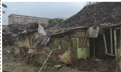
特別支援学校の宿舎はほぼ倒壊