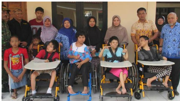
車いす寄贈式の様子

5～6月にかけてブカシ県の3地区で30名に車いすを寄贈しました。この県での車いす寄贈活動は、県社会事務所との協働事業として、昨年覚書を取交し2年目となりました。車いす寄贈者のデータ収集、寄贈までの日程調整、各地域の町内会長等への連絡、日常フォローアップは、各地区の社会事務所