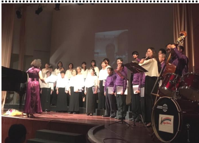
コンサートのようす

7月15日（土）バンコクにて、タイ日本人会歌謡コーラス部定期コンサートが開催されました。WAFCAT 前副理事長である故 政岡勲さんが所属していたクラブで、当日受付に設置された募金箱で23,100 タイバーツ（約74,000円）の寄付金が寄せられ、全額 WAFCAT へ寄付されました。WAFCAT では政岡さんの遺志を継いで車いす支援のための『政岡基金』を設立し、タイの障がい児への車いす支援活動に役立てています。昨年度は、基金から30,000バーツ（約96,000円）を車いす購入費に充て、カンチャナブリー県の障がい児に贈呈しました。