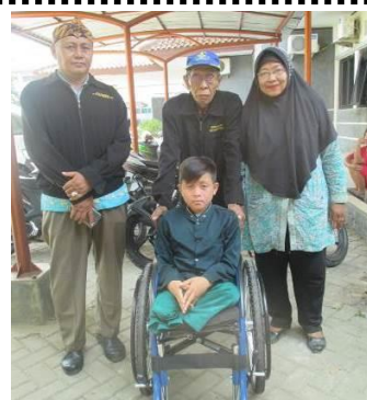
ソーシャルワーカーとロマトくん(12歳)

現在 WAFCAI には県社会事務所から届いた約 200 名の車いす希望者のリストが待機状態となっています。まずは各地区の地域ソーシャルワーカーと共にアセスメントから始めていきます。