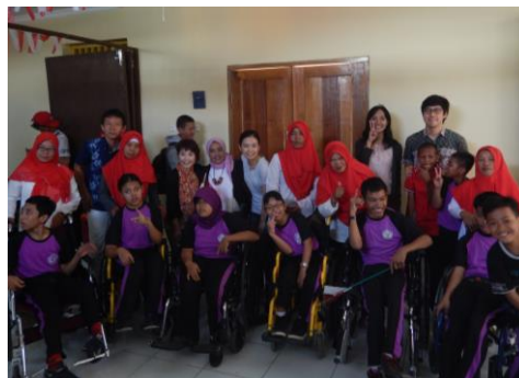
特別支援学校での集合写真