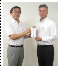
デンソー労働組合さま

デンソー労働組合さんより「ユニオンカーニバル」でのクルージング乗船料を、あいち健康の森走友会さんより愛知健康の森での「24時間リレーマラソン」参加者の皆さんからの募金を、デンソーセールスさんより「デンソー太陽納涼まつり」でのスーパーボールすくいの収益金をご寄付いただきました。ご寄付はアジアの障がいのある子どもたちへの車いす寄贈に充てさせていただきます。