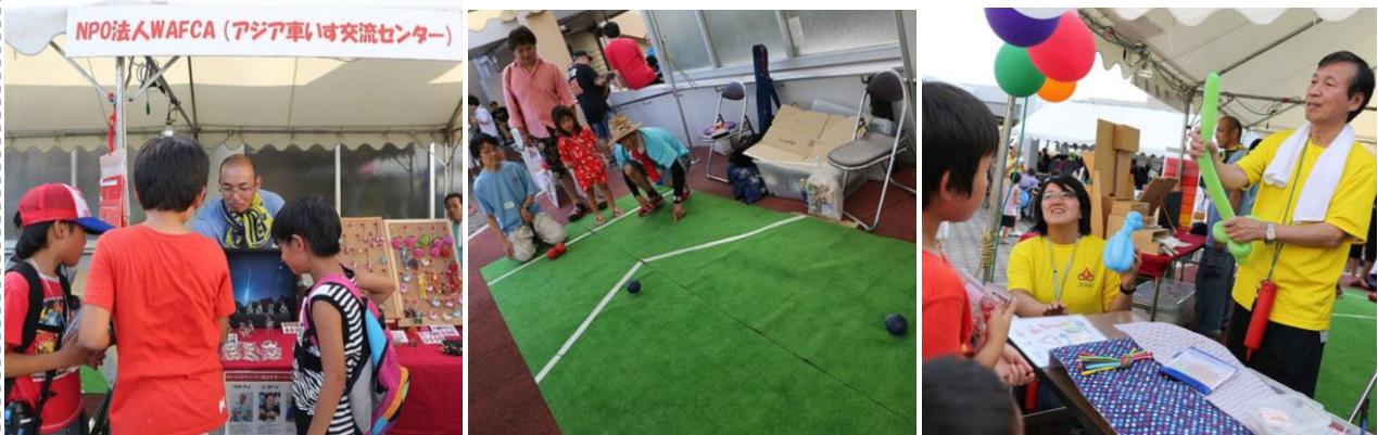
7/22 デンソー太陽納涼まつりにて

今年度1,000人体験を目標に行っており、体験募金で車いす3台を送る予定です。9月からのイベントでも行いますので、ぜひボッチャを知って、体験し、車いす寄贈に協力してください！