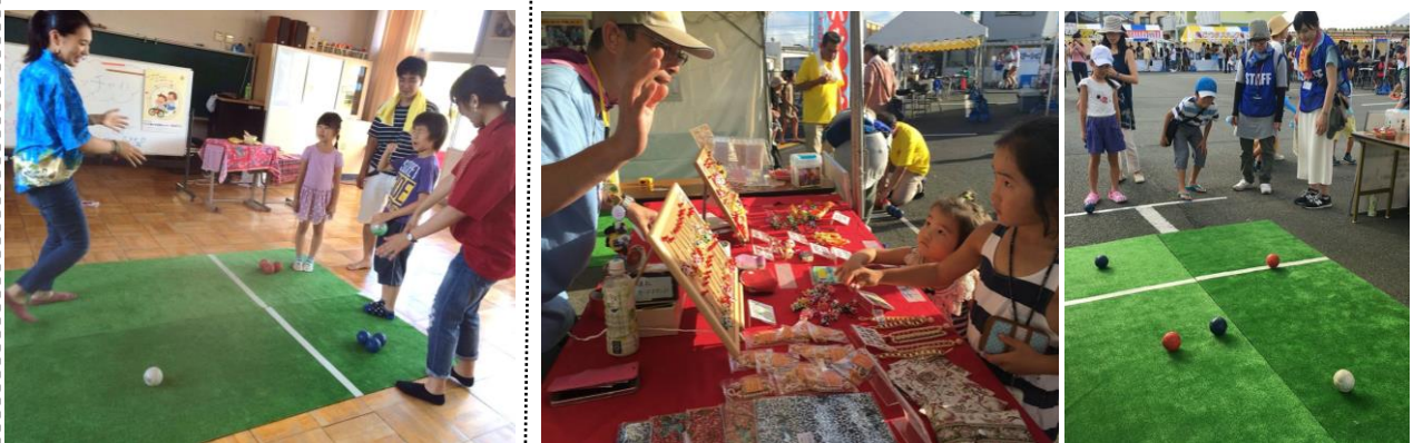
7/22 安城特別支援学校夏祭りにて