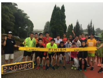
走友会参加者の皆さん