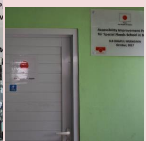
完成したバリアフリースイール