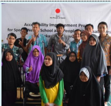
式典での車いすと松葉杖寄贈