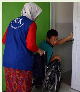
トイレを使用する生徒