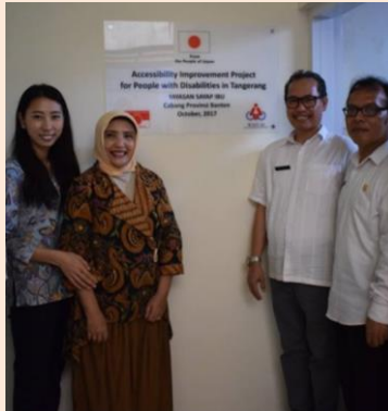
完成したバリアフリースイールの前で