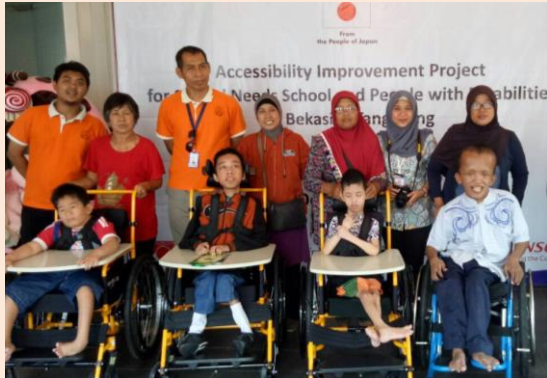
式典での車いす寄贈