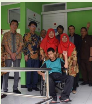
完成したトイレの前で