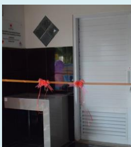
完成したバリアフリースイール