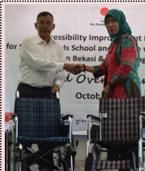
式典での車いす寄贈