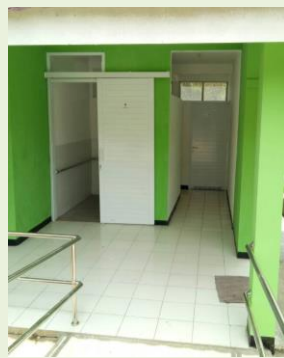
トイレとスロープ