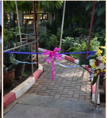
完成したスロープ