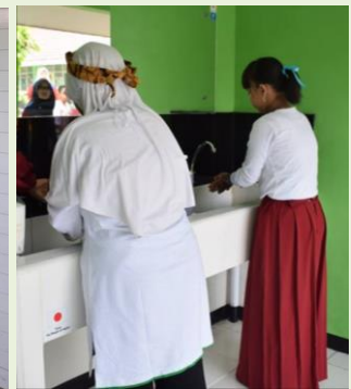
洗面所を使用する生徒たち