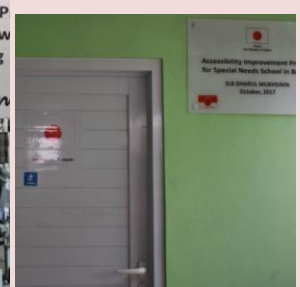
完成したバリアフリースイール