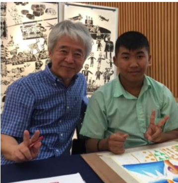
WAFCA 藤原理事とタイの生徒