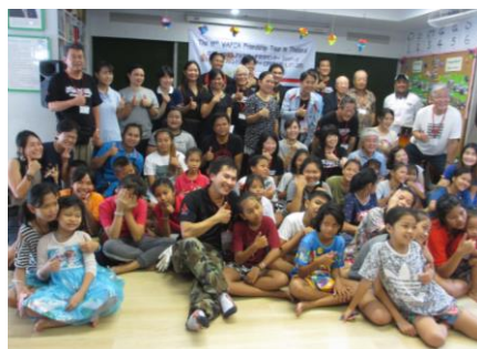
シーカーアジア財団にて全員でパチリ♪

※世界一大きな絵プロジェクト： http://www.bpw2020.com/ja