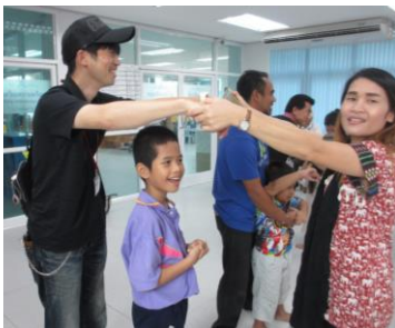
朝礼でゲームをする障がい児とツアー参加者(左)

今回のツアーは「～ゆったり～ゆっくり～」をテーマにベテランリピーターの方を中心に、3名の新規参加者を迎え実施しました。期間中は、タイと言えど11月とは思えない35℃前後の猛暑の中、特殊教育センターの朝礼に参加し、子ども達と体操やゲームを実施。WAFCAT設立時よりタイでの車いす提供を共に歩んだタイウィールにて車いすの組み立て体験や、クロントイスラムでは恒例の車いす修理活動に汗を流しました。