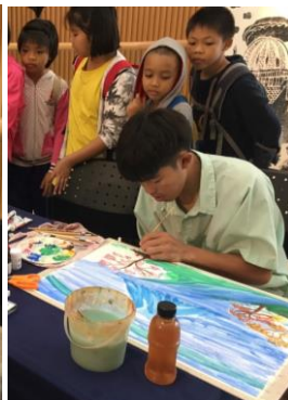
会場で富士山を描くタイの生徒