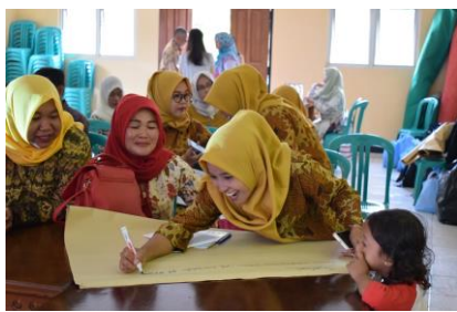
グループワークに取り組む保健師