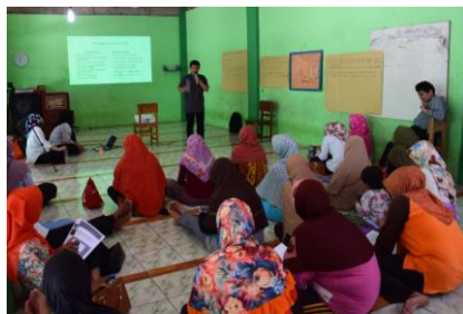
脳性まひについて学ぶ母親たち