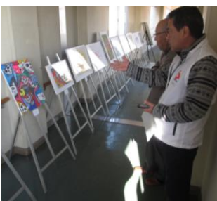
展示された絵を説明する様子

安城特別支援学校で行われた文化祭「あんJOYフェスタ」にブース出展させていただきました。安城特別支援学校とタイ・ロップリーパンヤヌグーン特別支援学校の姉妹校締結を仲介したことから交流がスタートした安城特別支援学校とWAFCA。今年は企画段階から社会人・学生による実行委員を組織して参加しました。出展内容は実行委員で協議し、「輪投げ」、タイ語にチャレンジする「タイ語教室」、WAFCA 活動紹介、姉妹校締結の歴史などを掲示。