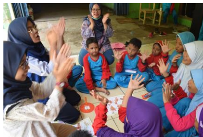
歌と共に手洗いの練習をする児童

10月上旬に実施した『学校バリアフリー化支援プログラム』の一環として、障がい児や保護者、教員を対象とした衛生管理・健康促進に関するトレーニング、WAFCAIの車いすを使用する家族と地域の支援者（ソーシャルワーカー・保健師）を対象とした障がいの種類とケア方法に関するセミナーを実施しました。このプログラムによって、家庭や学校で障がい児の健康を増進させる取組みが継続的に行われること、そして障がい児の家族が地域の中で孤立せず、助け合える関係ができていくことを目指しています。