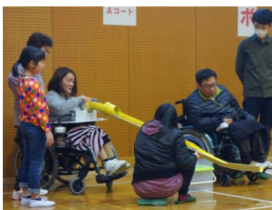
補助具「ランプス」を使ってボールを投げる方も

上がり、ポッチャの楽しさを実感できました。ゲーム後の表彰式では刈谷駅前商店街振興組合さんより上位チームに賞品が渡され、全員にぜんざいがふるまわれました。今後も地域での障がい理解促進活動に関わり、誰もが住みやすい町づくりに協力していけたらと思っています。