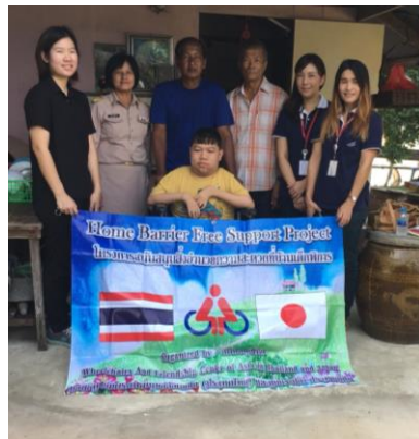
自宅バリアフリー支援贈呈式