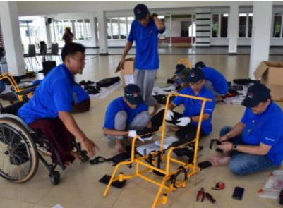
組立作業をする参加者の皆さん