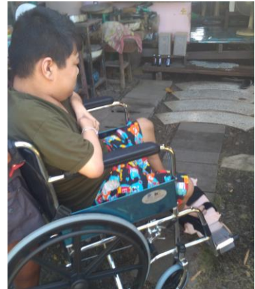
工事前の自宅玄関前 未舗装部分や段差あり