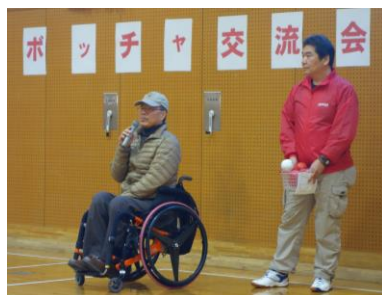
身体障害者福祉協会 会長さんによるルール説明