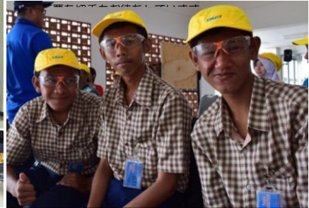
工場見学をする特別支援学校の生徒たち