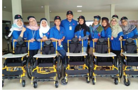
組立てた車いすとともに