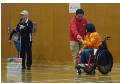
車いすの方へはボールを手渡しして協力

「障がいのある人とない人がポッチャを共に楽しむことを通じ、相互理解を深める」目的で開催された「ポッチャ交流会」にスタッフ兼選手として参加しました。参加選手は主催である「刈谷福祉交流エリアワークショップ」の「刈谷市身体障害者福祉協会」「あゆみの会」「アクセル」「刈谷駅前商店街振興組合」「刈谷市役所」の皆さん、デンソーボランティアの皆さん、刈谷市桜区住民の皆さんあわせて48名が集まりました。会が進むにつれ、チームメンバーも打ち解け、ゲームの進め方を相談したり、障がい者の方をサポートする様子が見られました。決勝戦は逆転ゲームとなって非常に盛り