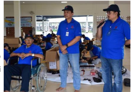
活動の始めに WAFCAI 理事より挨拶

日頃からWAFCAIの活動を支援してくださっている豊田自動織機のインドネシア生産子会社(以下TACi)のファジール工場(ブカシ県)にて「車いす組立てボランティアプログラム」を開催いたしました。当日はTACiから15名、DENSOインドネシアから5名の計20名の社員ボランティアと、障がい当事者団体から5名の参加者がグループに分かれて、子ども用の車いすを10台組み立てました。このプログラムの開催と併せて、ブカシ県立特別支援学校の生徒10名を招待し、TACiの工場見学も実施しました。参加した生徒たちは初めての工場の雰囲気で大興奮し、目を輝かせていました。