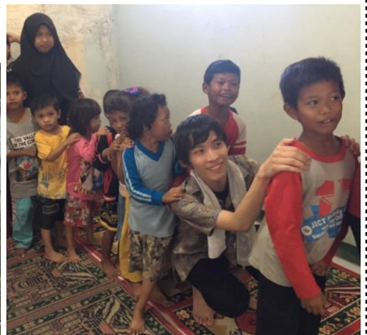
スラム街に住む子ども達との交流