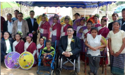
自宅でのバリアフリー工事完成式典