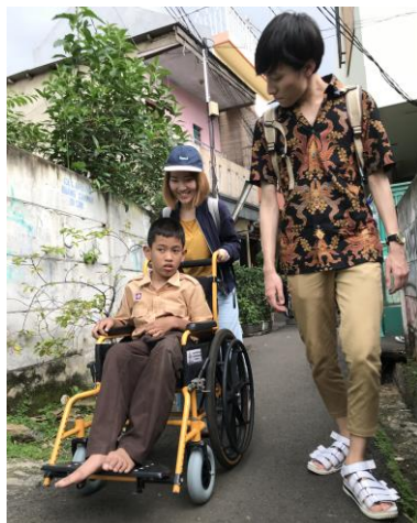
奨学生アジスクんと家の周囲を散歩