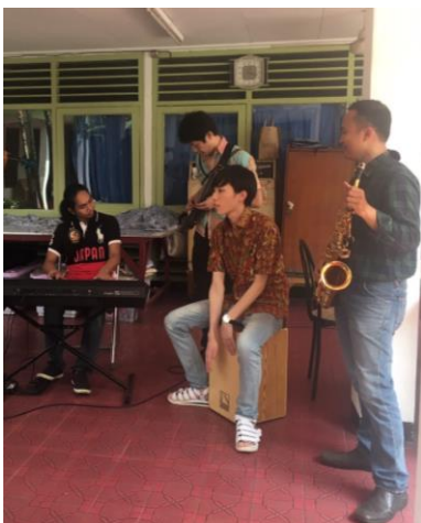
音楽交流ではAKB48の曲をともに演奏

渡航後には、「貴重な経験ができて本当に楽しかった。」「ぜひ周りの友達に今回の経験を伝えたい。」などの言葉をいただきました。