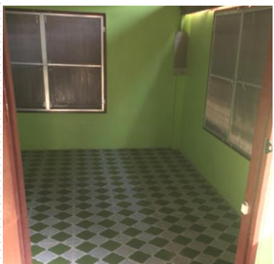
完成した部屋の中の様子