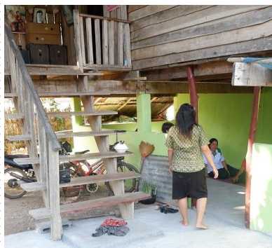
完成した1階の部屋と2階への階段

https://www.youtube.com/watch?v=laVZ42kG6BM