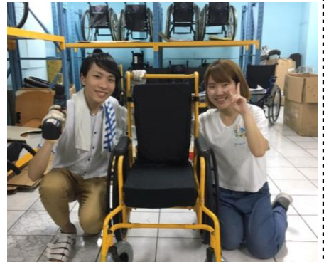
車いす組立体験をする参加者

「サヤップ・イブ財団」では参加者の方のアイディアで大きな風船を利用した風船バレーボールを実施。応援には空きペットボトルを用意し、現地で子どもたちと一緒に製作した手作りのメガホンを使用。「ウスマチェシア財団」では、日本語教室や音楽を通じた交流などを行いました。参加者の中には、日本や海外で障がい当事者の方との交流経験を持っている方や、海外渡航が初めての方までいらっしゃいましたが、各々の経験やアイディアを持ち寄った活動をしっかりと行うことができました。