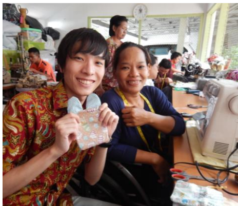
障がい者とボートを作る参加者(サヤップ・イブ財団)

またホームステイ体験は、現地デンソー社員の自宅に参加者一人ひとりが個別に1泊。各ホストファミリーはインドネシアの伝統的な料理を用意してくださるなど、様々な工夫を凝らしもてなしてくださいました。翌日は各々がホストファミリーとジャカルタ市内を観光。観光後は全家族が揃いお別れ会を開催しました。