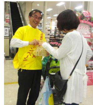
黄色いレシートキャンペーン参加時

さらに多くの賛同者や支援の輪を広げられるよう、職員一同、力を尽くまいりますので、本年度も引き続きよろしくお願ひします。