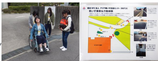
車いす乗車体験の様子

昨年までは WAFCA オフィスにある、踏切や段差を模したボードを使って車いすの乗車体験をしていただいていたのですが、今年は事前に WAFCA オフィス周辺のバリアーを実際に車いすに乗り確認し、車いす乗車体験 MAP を作成。各ポイントをグループごとに体験していただきました。