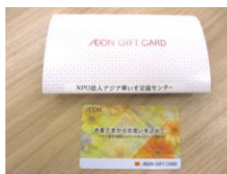
いただいた寄付カード

イオン幸せの黄色いレシートは、毎月 11 日に発行されるレシートを、応援したい登録団体のポストに投函していただくと、買い物金額の 1% がその団体に寄付される仕組みです。2017 年度中に集まったレシートから、合計で 19400 円の御寄付をいただきました。いただいた御寄付は、WAFCA の備品購入費用に充てられます。ご投函いただいた皆様、誠にありがとうございました。そしてザ・ビッグエクストラ刈谷店でお買い物の際、黄色いレシートが発行されたら、ぜひ WAFCA の投函 BOX へよろしくお願ひいたします！