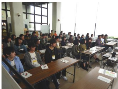
訪問された新入生の皆さん