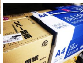
購入したコピー用紙