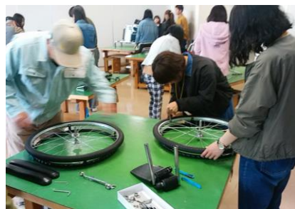
車いす修理・組立体験

ご訪問いただいた学生の皆さまからは「とても貴重な体験ができた」「実際に車いすに乗ったことがなかったので、思ったよりも大変だった」「今後の糧にしていきたい」などの感想をいただきました。ご訪問ありがとうございました！新入生の皆さん新生活頑張ってください！