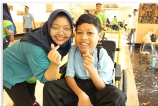
←車いすダンスに参加したワヒユ君