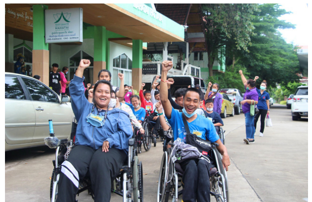
タイでWAFCAから奨学金を受けて勉強している子どもたち